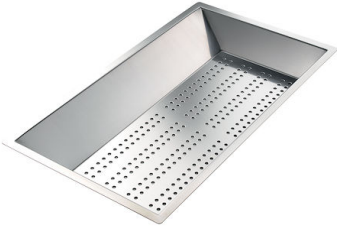
Cuvette perforée en acier inoxydable